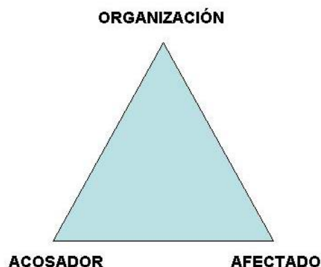
Triángulo del acoso

La relación entre estos tres elementos puede ser representada por un triángulo con cada uno de ellos como vértice (figura 1).